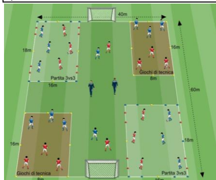
Soluzione Gioco 1