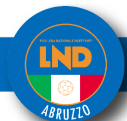
Tabella valutazione titoli per completamento Organico S.S. 25/26 Calcio A 5