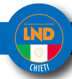
Tabella Riepilogativa Scadenze Tesseramenti Calcio A 5