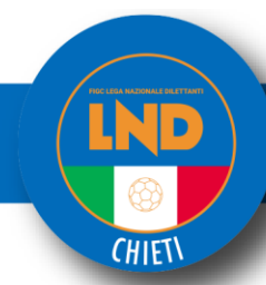
Tabella Riepilogativa Scadenze Tesseramenti Calcio A 5