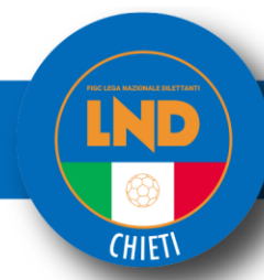
Tabella Riepilogativa Scadenze Tesseramenti Calcio A 5