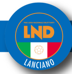
Tabella Riepilogativa Scadenze Tesseramenti Calcio A 5