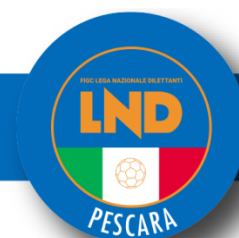
Tabella Valutazione Titoli C5