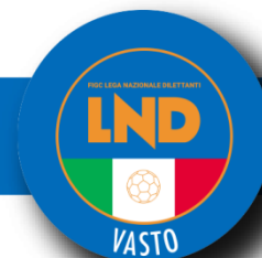
TABELLA VALUTAZIONE TITOLI PER COMPLETAMENTO ORGANICO S.S. 2026-2027 CALCIO A CINQUE

TABELLA VALUTAZIONE TITOLI PER COMPLETAMENTO ORGANICO S.S. 2026-2027 CALCIO A UNDICI