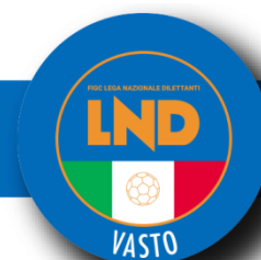
TABELLA VALUTAZIONE TITOLI PER COMPLETAMENTO ORGANICO S.S. 2026-2027 CALCIO A CINQUE

TABELLA VALUTAZIONE TITOLI PER COMPLETAMENTO ORGANICO S.S. 2026-2027 CALCIO A UNDICI